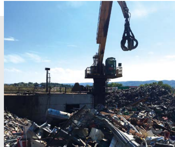
↑ Le site DADDI-SRI de Marignanne renouvelle en 2019 son process de transformation des ferrailles.

Parallèlement, le site DADDI-SRI de Marignanne, déjà équipé depuis 2 ans d'une installation de pointe pour le traitement des DEEE, renouvelle en 2019 son process de transformation des ferrailles. « Nous allons installer une nouvelle presse-cisaille de 1 400t de capacité et une nouvelle grue Seram